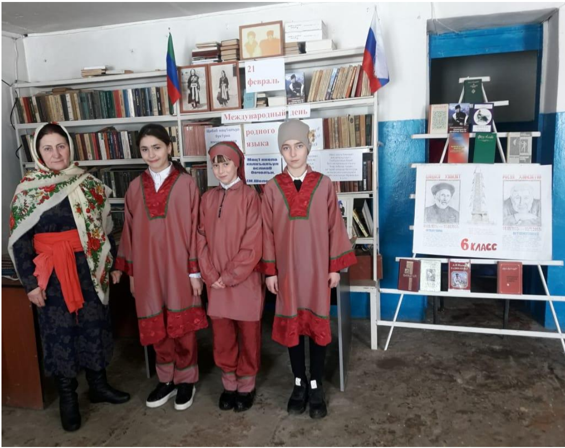
Оформление в сельской библиотеке